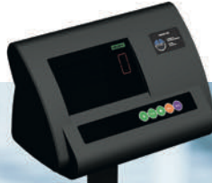
Kolon / Column